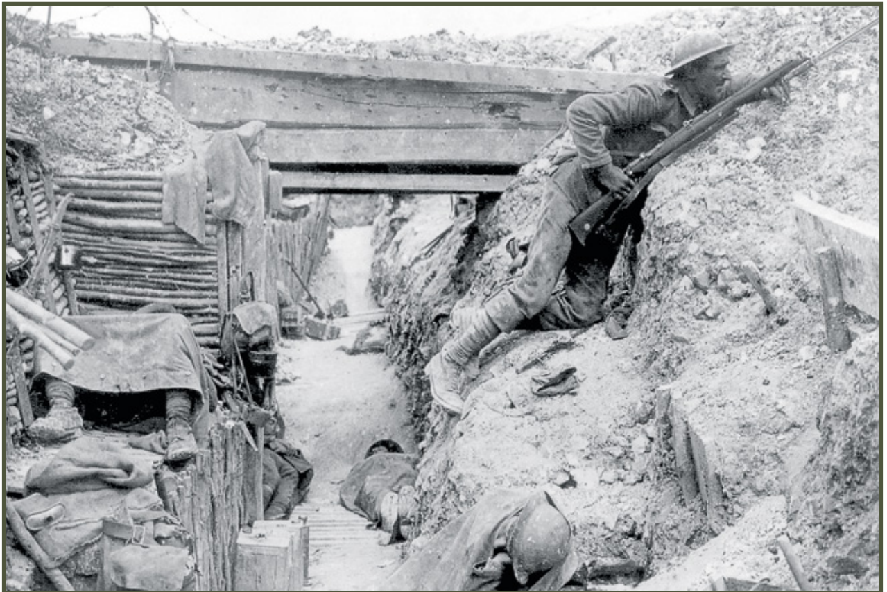
Brytyjskie okopy w trakcie bitwy nad Sommą (1916)