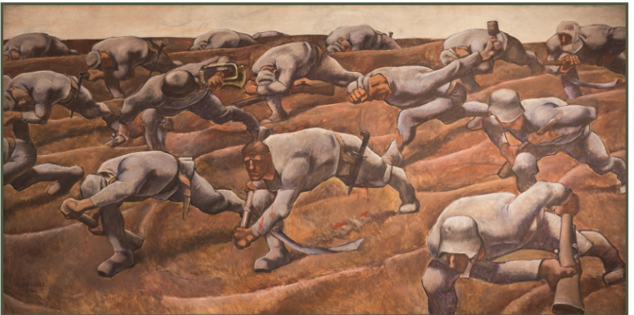
Die Namenlosen , 1916, Albin Egger-Lienz (1868–1926)