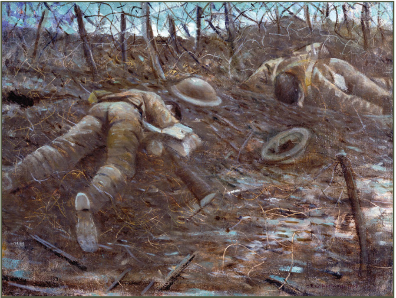
Paths of Glory , 1917, Christopher R. W. Nevinson (1889–1946)