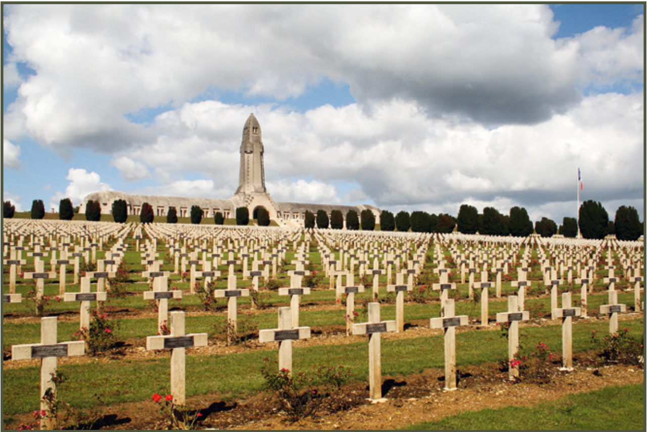
Cmentarz pod Verdun