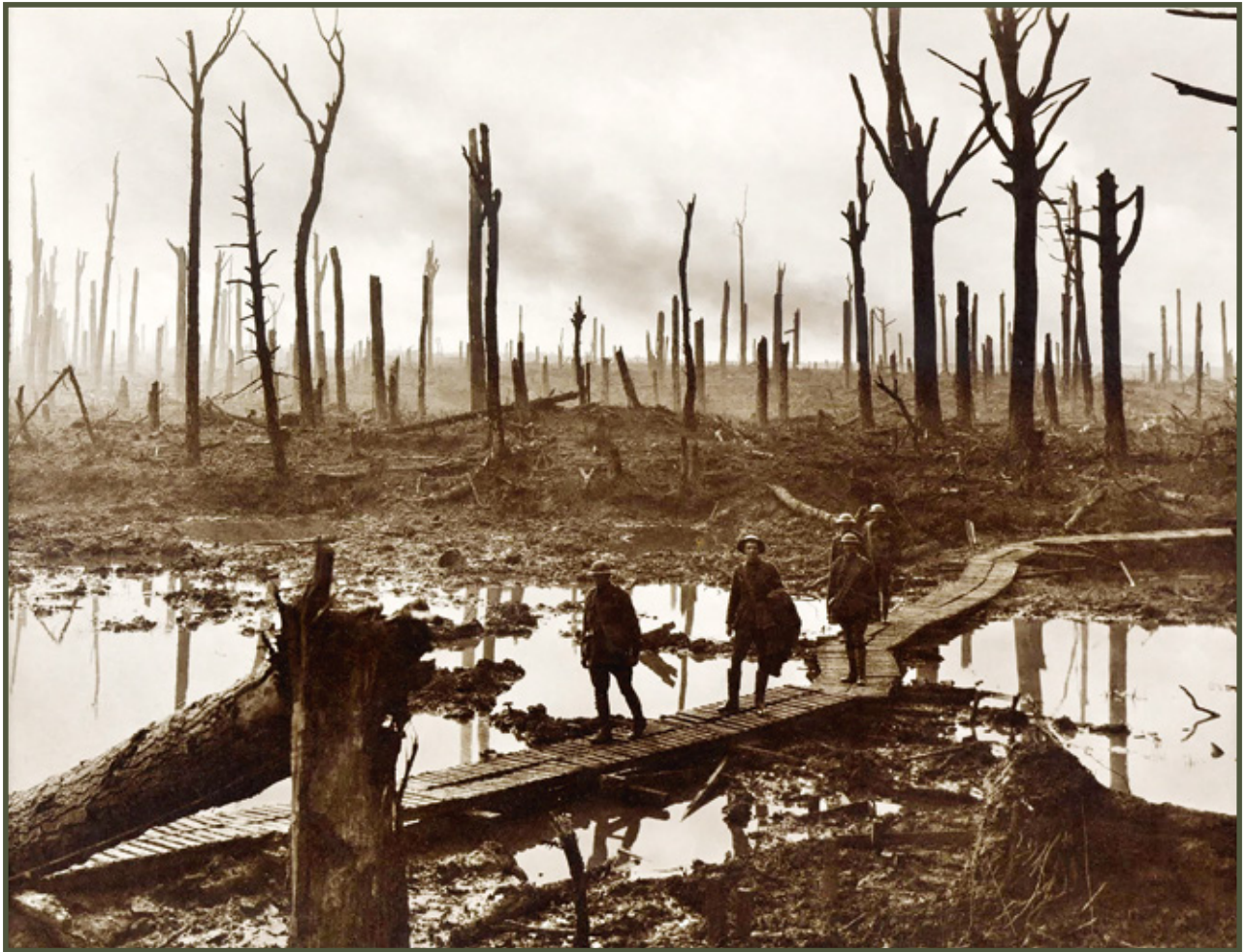
Chateau Wood (trzecia bitwa pod Ypres – 1917)