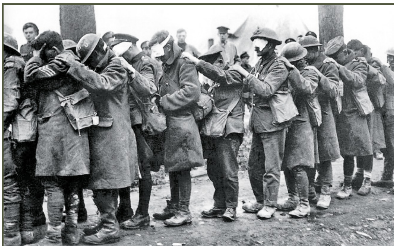
Żołnierze brytyjscy oślepieni gazem