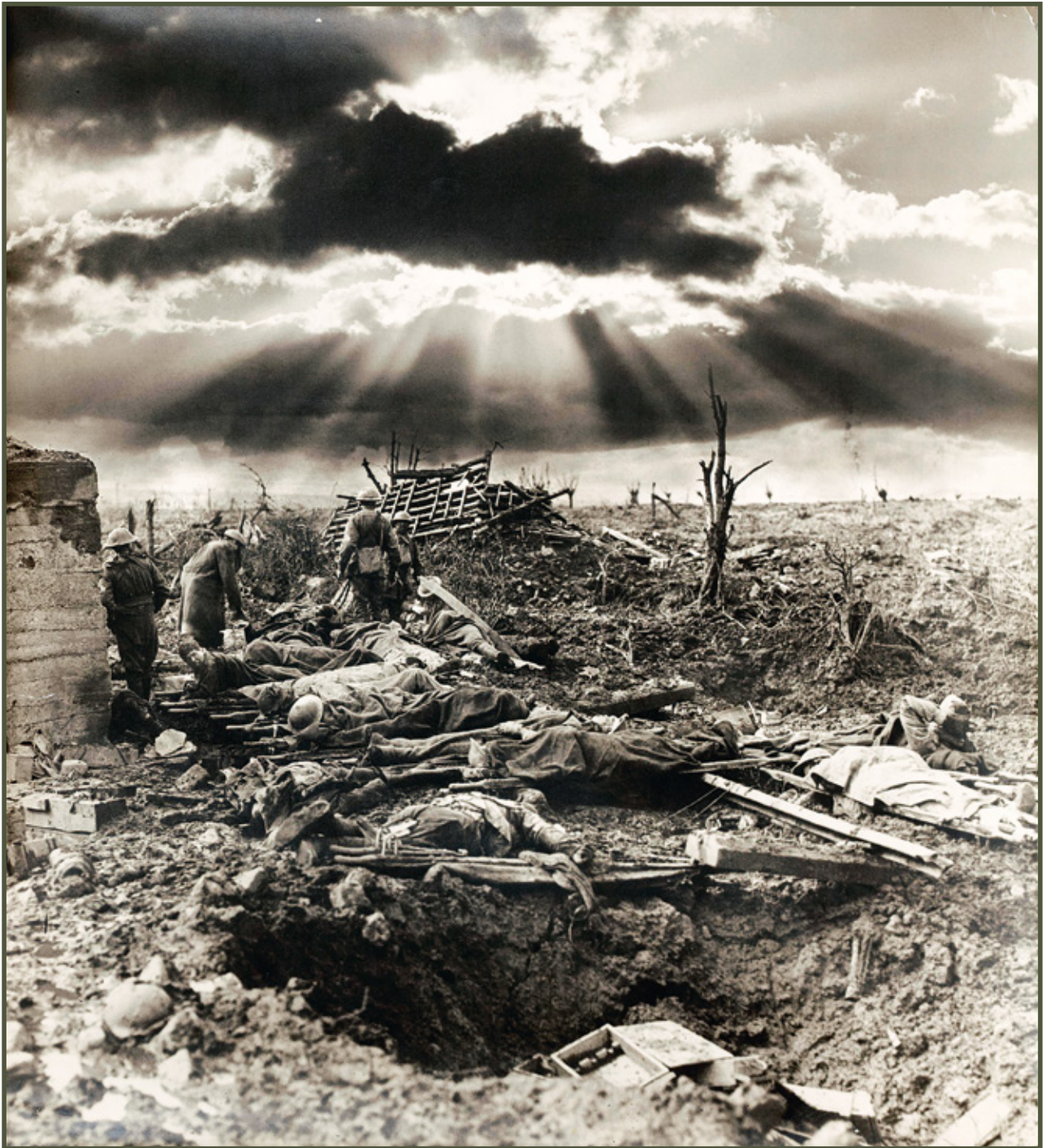
Poranek pod Passchendaele (trzecia bitwa pod Ypres – 1917)