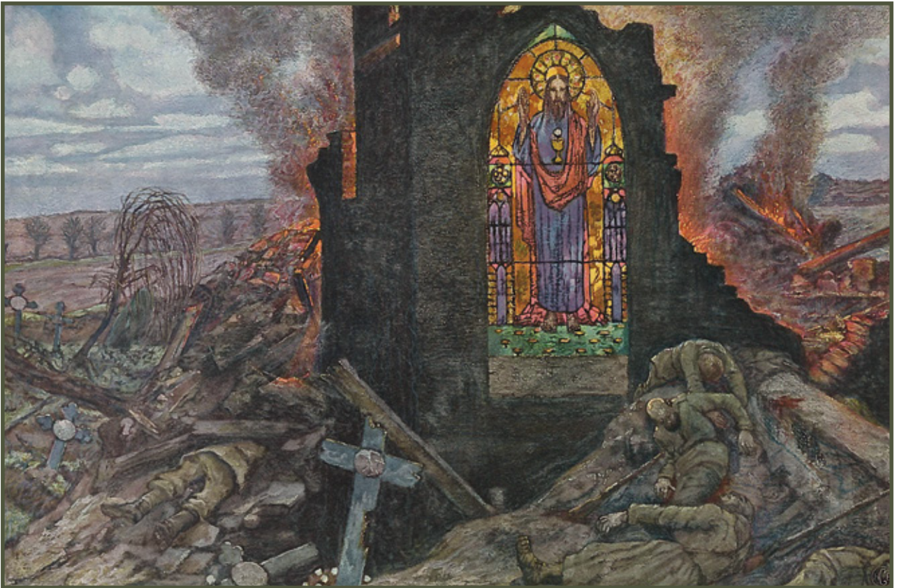
Das Kirchenfenster , 1915, Hans Baluschek (1870-1935)