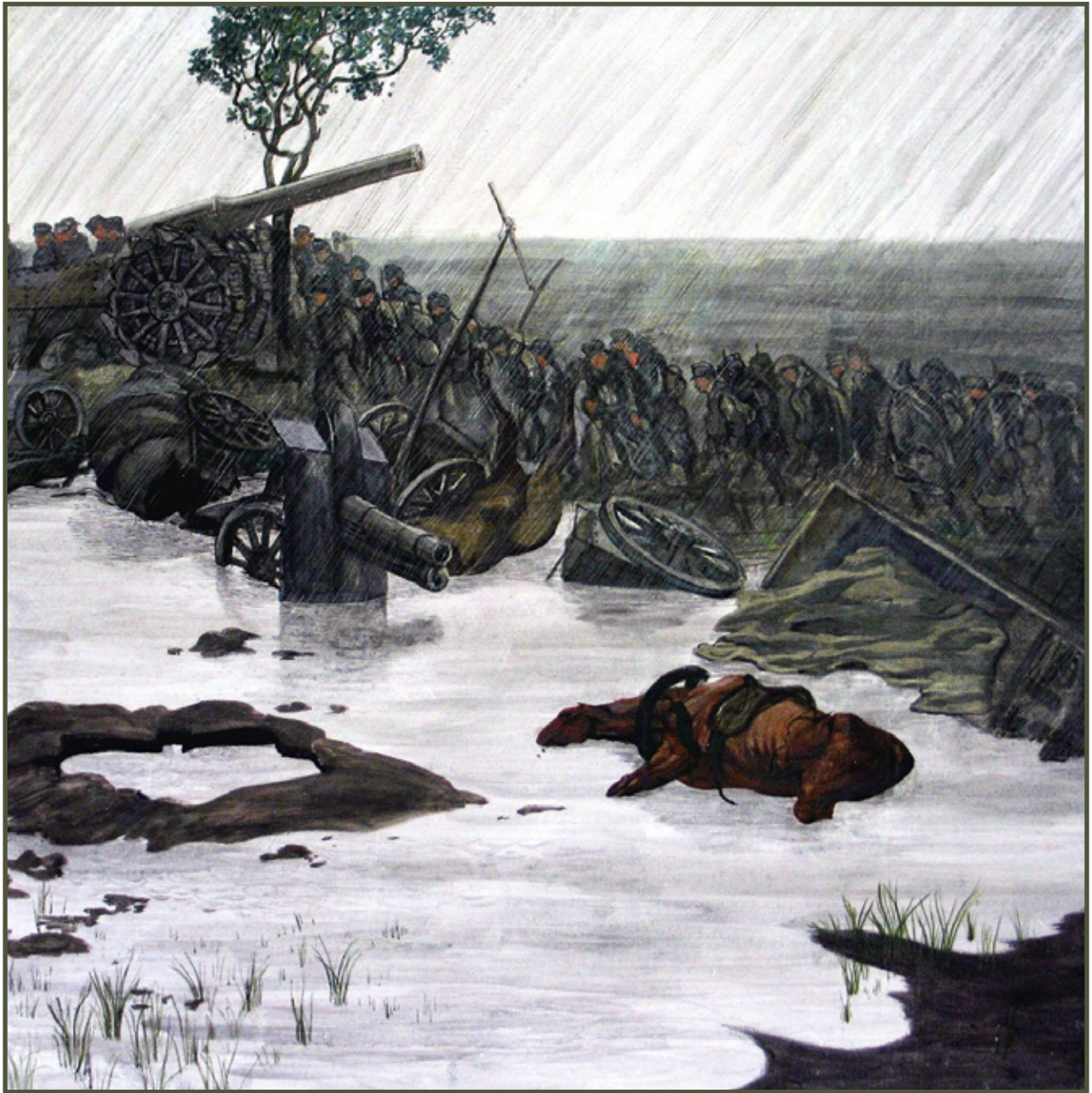
Nach dem Durchbruch am Tagliamento , 1918, Alfred Basel (1876–1920)