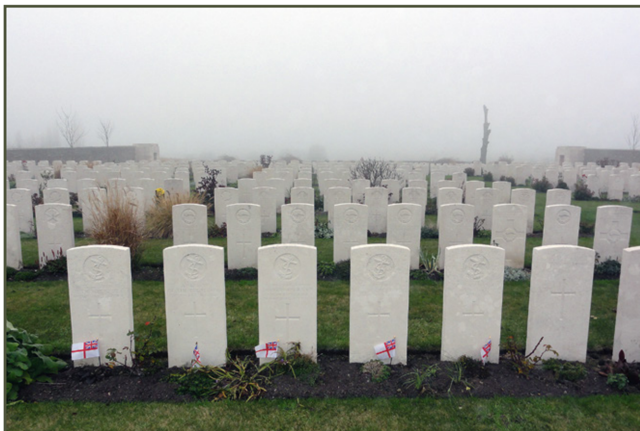
Cała linia frontu (pola Flandrii, Ypres, Verdun) usiana jest cmentarzami poległych Brytyjski cmentarz pod Passchendaele