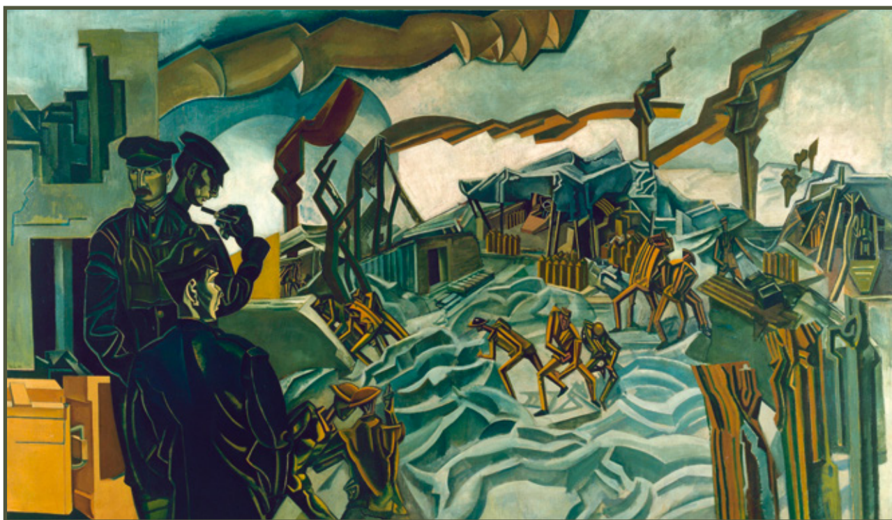
A Battery Shelled , 1919, Percy Wyndham Lewis (1882–1957)

związanych tematycznie z I wojną światową. Wszystkie obrazy pochodzą z domeny publicznej.