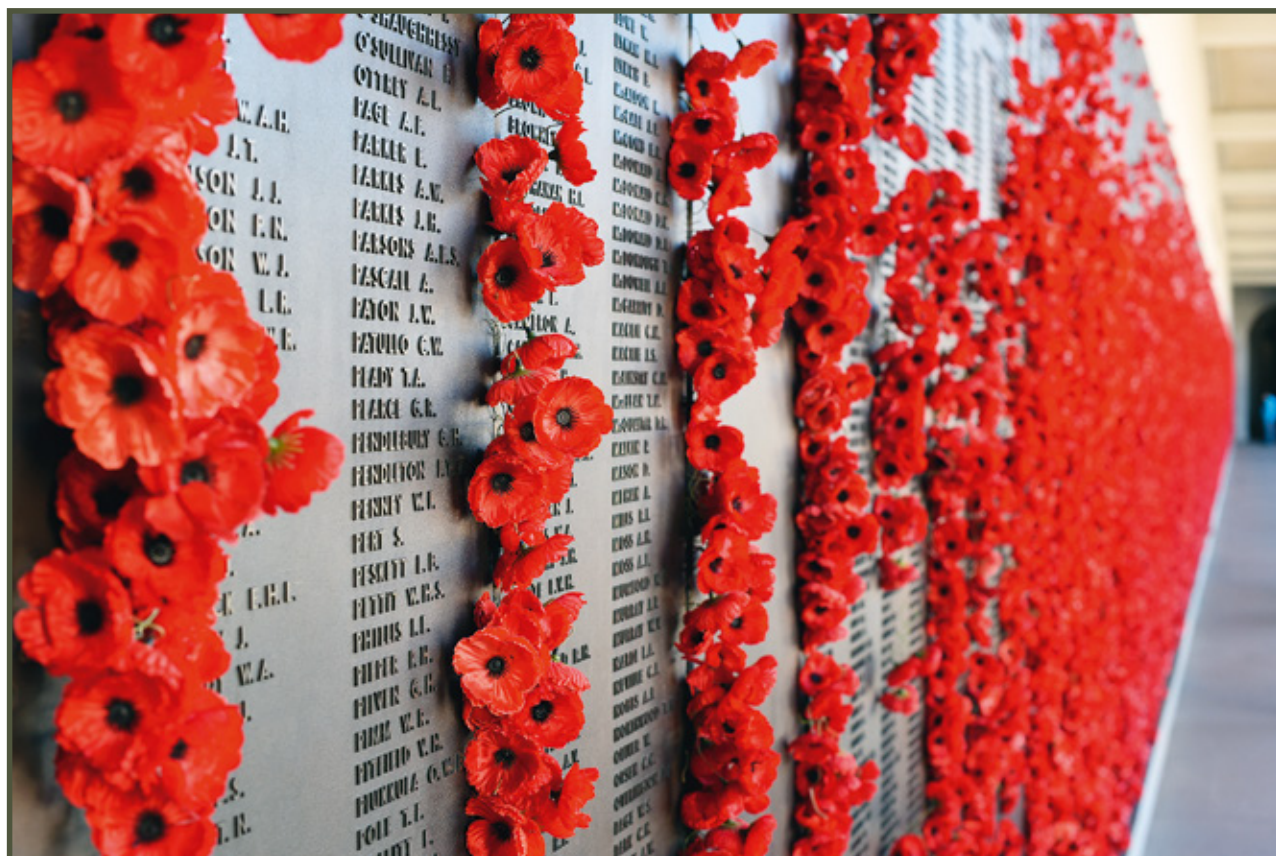
Poppy Day to amerykański i brytyjski dzień pamięci o poległych w I wojnie światowej